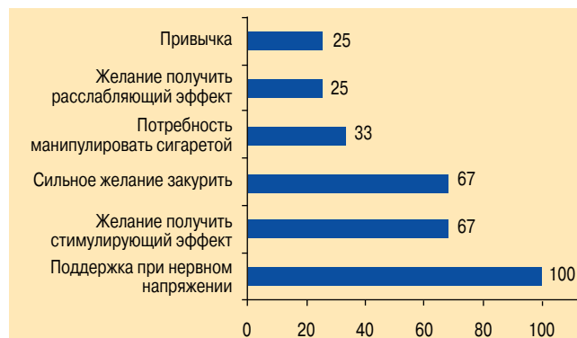
Рис. 3. Мотивация к курению